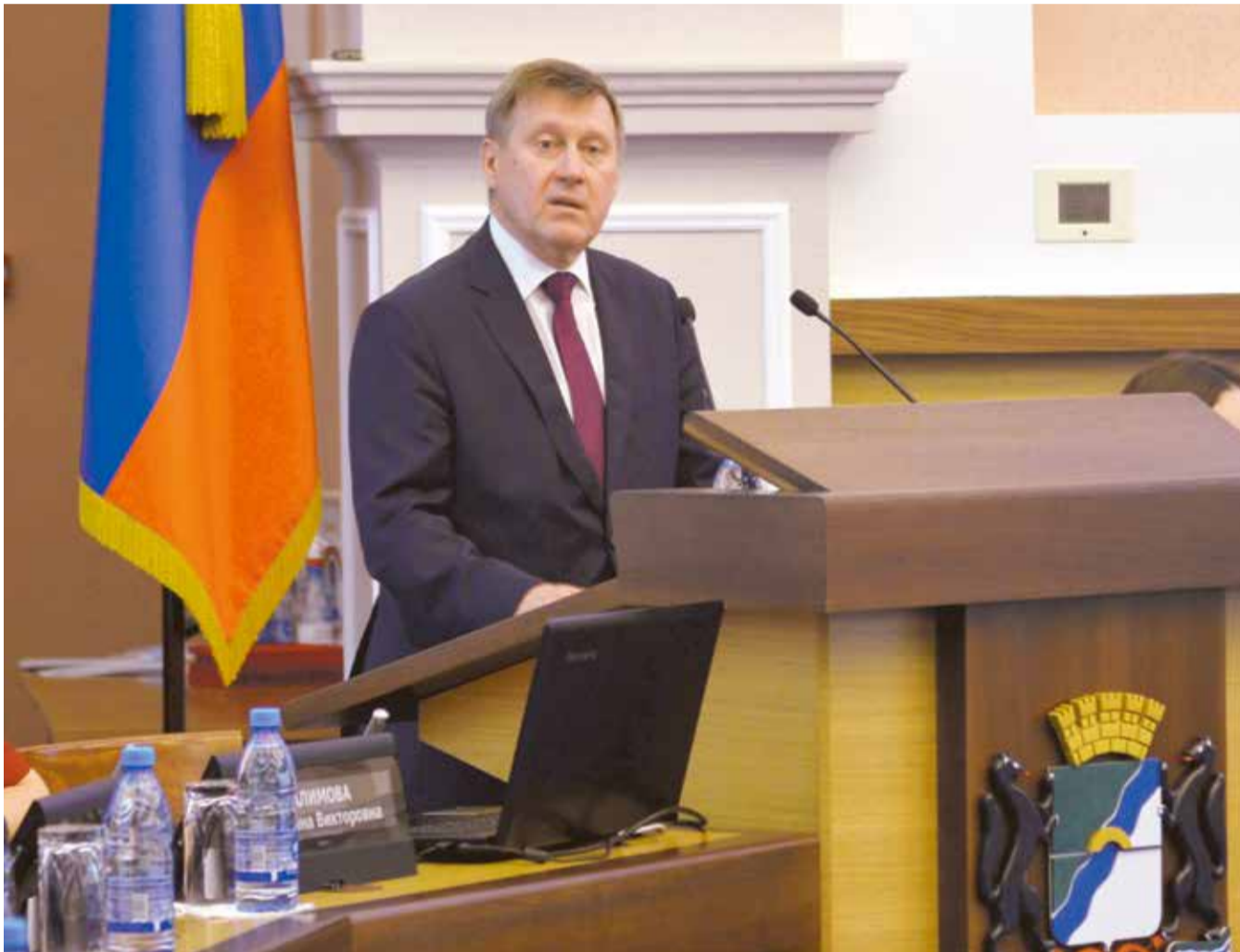
НА ФОТО: МЭР НОВОСИБИРСКА АНАТОЛИЙ ЛОКОТЬ ВЫСТУПАЕТ НА ПЕРВОЙ СЕССИИ ГОРСОВЕТА НОВОГО СОЗЫВА