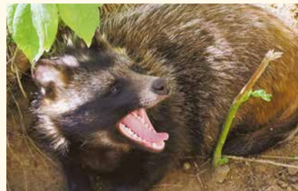
НА ФОТО: ЕНОВОИДНАЯ СОБАКА

Енотовидные собаки заполнили поселения в Чистоозерном и Венгеровском районах. С начала лета хищники уничтожили сотни птиц. Местные жители говорят, что енотовидные собаки невероятно размножились за последние годы, и наносят большой урон личным подворьям.