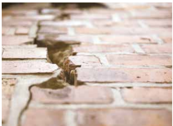
НА ФОТО: ТРЕЩИНЫ НА СТЕНАХ — «ПОДАРОК» НОВОСЕЛАМ.

Жители села Каменка не испытывают радости от въезда в новые квартиры микрорайона «Олимпийской славы». От удобства и комфорта здесь только название, ведь собственники получили вместо новостроек дома с трещинами.