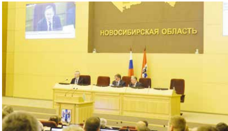
НА ФОТО: ПЕРВАЯ СЕССИЯ ЗАКОНОДАТЕЛЬНОГО СОБРАНИЯ НОВОСИБИРСКОЙ ОБЛАСТИ НАЧАЛА РАБОТУ