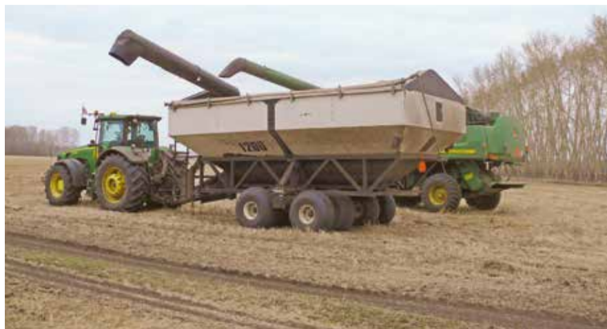
НА ФОТО: РАБОТА В ПОЛЯХ КИПИТ

За семь месяцев этого года на экспорт из Новосибирской области было отправлено 171,9 тыс. тонн зерновых. Это почти в три раза больше, чем в прошлом году. Значительная часть зерновых была доставлена в Кыргызстан, Турцию, Казахстан, Монголию и Азербайджан, но вне зависимости от высоких темпов экспорта цена на пшеницу в Новосибирской области выросла. В конце августа рост произошел в связи с потерями от засухи, теперь аграриям противостоят дожди. Напомним, что с 23 июля в регионе был введен режим ЧС в 16 районах. От жары